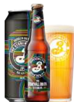
BROOKLYN STONEWALL INN IPA

Humleluften byder på referencer til citrus, ananas & mango, og mundfornemmelsen er blød mens smagen domineres af en afstemt frisk, mild og humlet bitterhed.