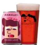
MIKKELLER ICH BIN RASPBERRY

Berliner weisse med noter af modne hindbær.