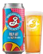
BROOKLYN PULP ART

Brooklyn Pulp Art IPA, er en hazy IPA. Duften er præget af tropiske citrusfrugter, og smagen er frisk, med noter af citrus og mango.