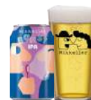
MIKKELLER BURST IPA

Frugtig IPA, frisk citrus aroma og smag af grapefrugt og appelsinskal.