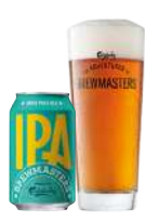
BREWMASTERS INDIA PALE ALE

Brewmasters Collection India Pale Ale er en ravgylde ale med en frisk humleduft, en velbalanceret smag og en god efterbitterhed.