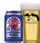
MIKKELLER JAPA- NESE RICE LAGER

Let og klar pilsner, beriget med subtile noter af kokos og lime.