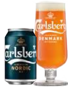
CARLSBERG NORDIC ALE

Alkoholprocent: 0,5 33 cl fl, 33 cl ds 20 l MD